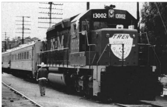
“El Constitucionalista” anuncia el inicio de sus operaciones, horarios y tarifas en 1986.

https://www.facebook.com/cinemexicanomx/photos/pcb.10158311313815067/10158311313705067/?type=3&theater