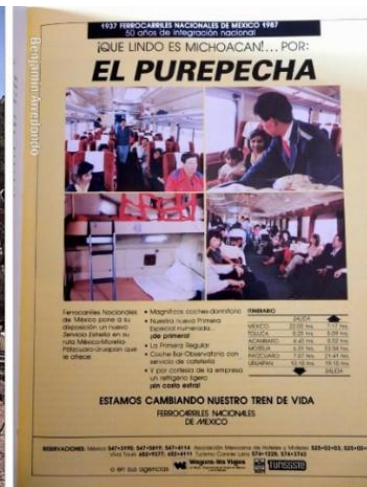
“El Purépecha” saliendo de la estación de Uruapan, Michoacán. Asientos cómodos, servicio personalizado, dormitorios y amplios vagones ofrecían en este tren los Ferrocarriles Nacionales de México al cumplir 50 años de unir al país (1937-1987).